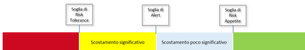
Figura 1 – Significatività livelli di scostamento

La struttura di soglie e obiettivi di rischio adottata consente di intercettare early warning per gli ambiti monitorati.